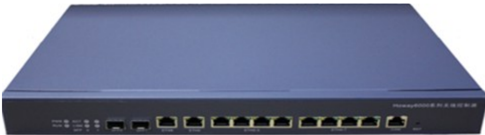
（图一）Howay AC-128 无线控制器

Howay AC-128 系列无线控制器（图一），提供 8 个千兆以太网口、2 个千兆以太网口、2 个千兆光口，最大可管理 128 台 AP，不支持扩展。