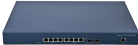
(图一)Howay AC-1024 无线控制器

Howay AC-1024 系列无线局域网控制器（图一），提供 8 个千兆以太网口、2 个千兆以太网口、2 个千兆光口，最大可管理 1024 台 AP，不支持扩展。